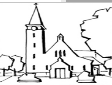
Onze lieve Vrouw van Goede Raad en H. Jozef Asenray