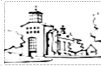
Onze Lieve Vrouw van Altijddurende Bijstand