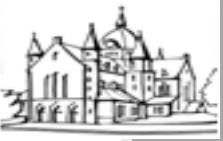
H.Hart van Jezus 't Veld

Moge de verrezen Christus wegen wijzen van hoop voor het geliefde