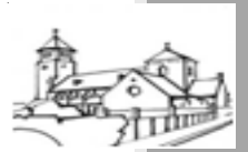
St. Laurentius Maasniel