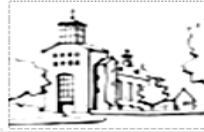
Onze Lieve Vrouw van Altijddurende Bijstand