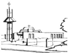
De Goede Herder