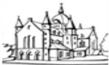
H.Hart van Jezus † Veld