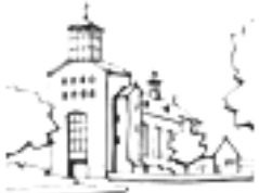
Onze Lieve Vrouw van Altijdurende Bijstand

Afgelopen november heeft onze paus Franciscus een Apostolische Exhortatie uitgegeven. Dit document was het resultaat van de Bisschoppensynode over de Nieuwe Evangelisatie die het jaar daarvoor in Rome had plaatsgevonden. De naam van dit pauselijke schrijven is Evangelii Gaudium , wat betekent: De Vreugde van het Evangelie. Ik zou jullie graag willen uitnodigen om deze brief van de Paus te lezen vanwege zijn groot belang voor de toekomst van de kerk; toekomst die afhankelijk is van onze inzet vandaag. Daarom heb ik in het voorwoord van het parochienieuws van deze maand een paar teksten opgenomen uit de inleiding op deze Apostolische Exhortatie.