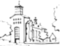
Onze Lieve Vrouw van Altijd durende Bijstand

In order to receive what God gives us and to make it bear abundant fruit, we need to press beyond the boundaries of the visible Church in two ways.