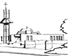
De Goede Herder

We share in the merits and joy of the saints, even as they share in our struggles and our longing for peace and reconciliation. Their joy in the victory of the Risen Christ gives us strength as we strive to overcome our indifference and hardness of heart.