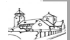
St. Laurentius Maasniel