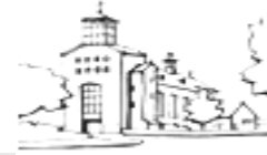
De Goede Herder Hoogvonderen