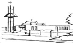
St. Jozef Leeuwen