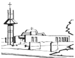
De Goede Herder

In deze zin gaan onze gedachten in de eerste plaats, in dankbaarheid, uit naar hen die ons zijn voorgedaan en die ons in de Kerk hebben ontvangen. Niemand wordt uit zichzelf christen! Christenen worden niet in een laboratorium gemaakt. Als we geloven, als we weten hoe we moeten bidden, als wij de Heer kennen en naar zijn Woord luisteren, als wij Hem nabij voelen en Hem herkennen in onze broeders, dan is dat zo omdat anderen, vóór ons , het geloof hebben geleefd en het aan ons hebben doorgegeven.