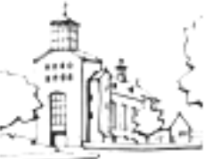
Onze Lieve Vrouw van Altijd durende Bijstand

Tijdens een algemene audiëntie sprak paus Franciscus over deel uitmaken van het volk van God. Wij zijn christenen omdat we bij de Kerk horen. Het is als een achternaam: als mijn naam is: "Ik ben christen" dan is mijn achternaam: "Ik hoor bij de Kerk". Het is heel mooi om te zien dat dit erbij horen ook wordt uitgedrukt in de naam die God zichzelf geeft. Hij zegt niet: Ik ben de Almachtige..., nee: Ik de de God van Abraham, Isaak en Jacob . Zo manifesteert Hij zich als de God die een verbond is aangegaan met onze vaders en altijd trouw blijft aan zijn pact, en ons roept om binnen te treden in die relatie, die aan ons voorafgaat.