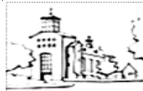
Onze Lieve Vrouw van Altijddurende Bijstand