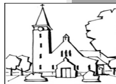
Onze lieve Vrouw van Goede Raad en H. Jozef Asenray